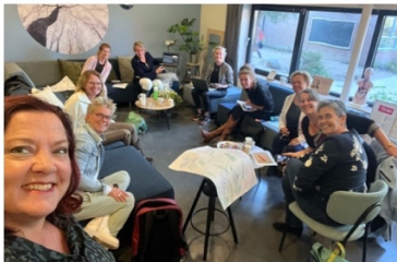
VNK-Ambassadeurs Studiemiddag 29-09-2022

De praktijkvoorbeelden zullen komend jaar worden uitgebreid. Hiertoe zullen de leden worden bevroegd. De uitvraag is momenteel in ontwikkeling. Hier zullen ook de ambassadeurs worden betrokken.